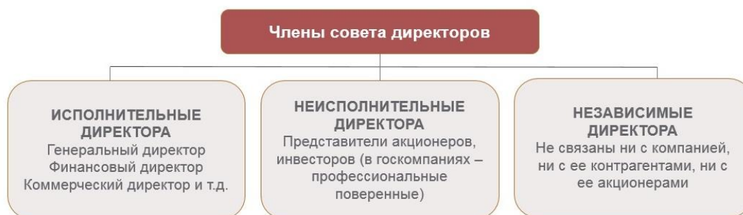
Рисунок 1. Классификация членов совета директоров

Исполнительные директора 44 являются связующим звеном между советом директоров и менеджментом организации. Они помогают транслировать сотрудникам организации ключевые положения стратегии, а также ожидания совета директоров относительно параметров ее достижения. Кроме того, исполнительные директора являются дополнительным каналом предоставления совету директоров информации при вынесении суждений и принятии решений, поскольку исполнительные директора обладают наиболее полной информацией о компании и ее возможностях. При избрании в совет директоров исполнительным директорам следует принимать во внимание, что членство в совете директоров накладывает на них соответствующие обязанности, и они уже не должны рассматривать себя исключительно в качестве членов команды менеджмента организации. Высокая осведомленность исполнительных директоров о том, что происходит внутри организации, является залогом принятия советом более взвешенных и качественных решений, сочетающих внутренний и внешний взгляд на деятельность организации.