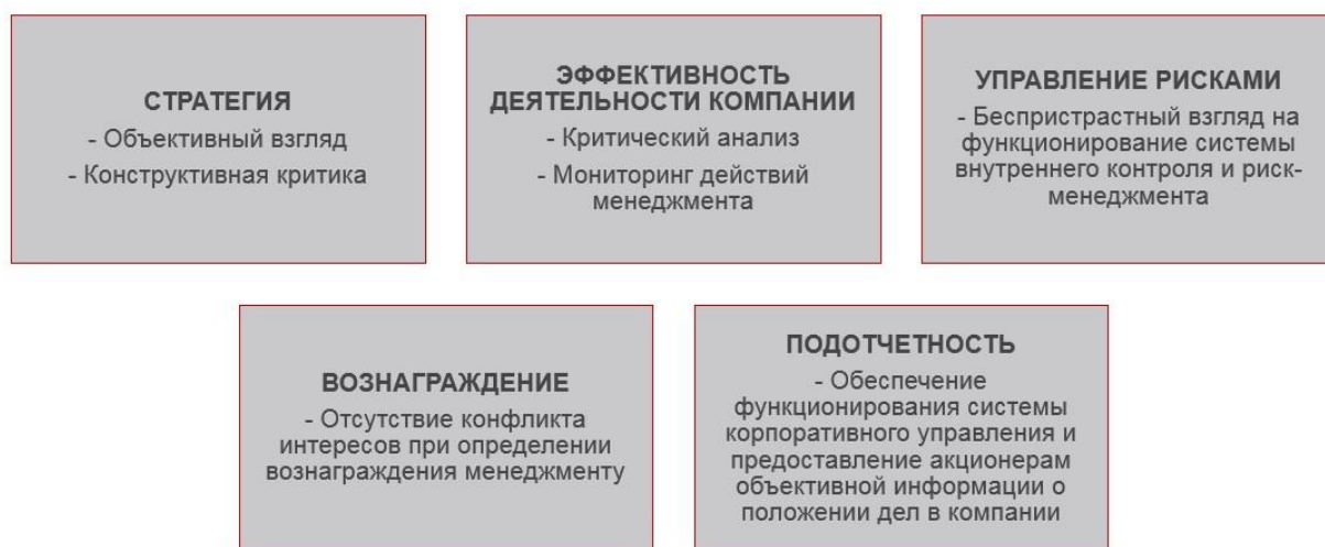
Рисунок 2. Роль независимых директоров

Роль независимых директоров в совете директоров финансовой организации схематично представлена на рисунке 2.