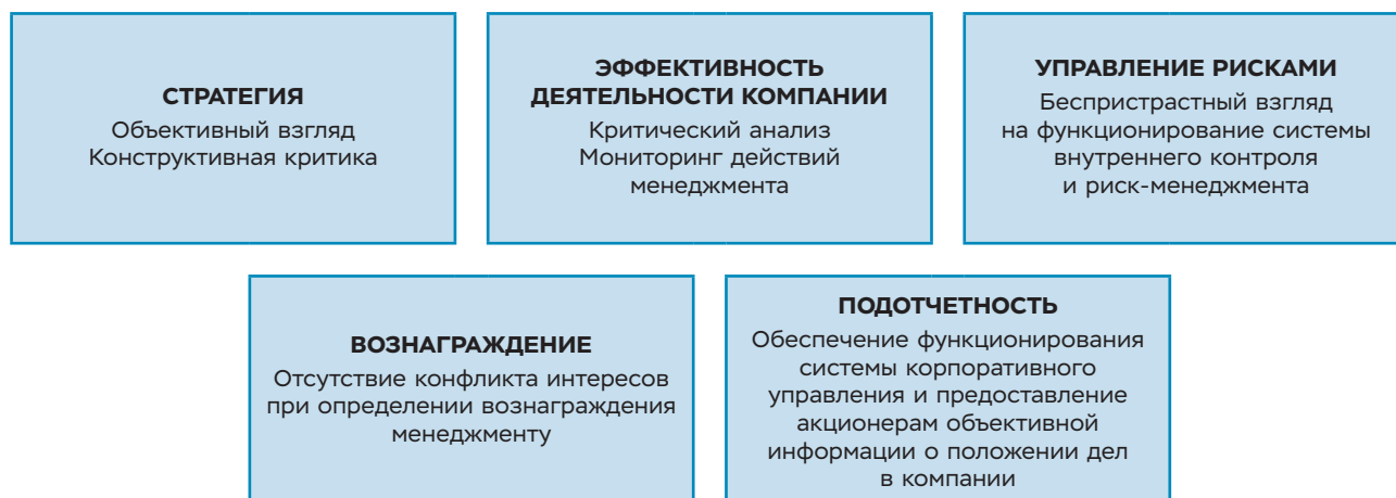
РИСУНОК 2. РОЛЬ НЕЗАВИСИМЫХ ДИРЕКТОРОВ